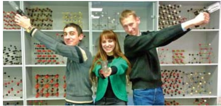
Как дожить до диплома (стр. 6)