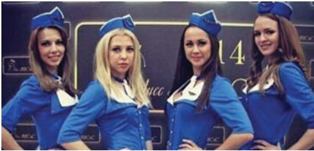
Балерины из МИСиС (стр. 6)