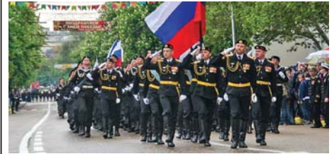
Севастополь родной! (стр. 4)